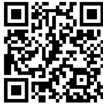
สร้างความเข้าใจ มาตรา ๑๓๐ และมาตรา ๑๒๐