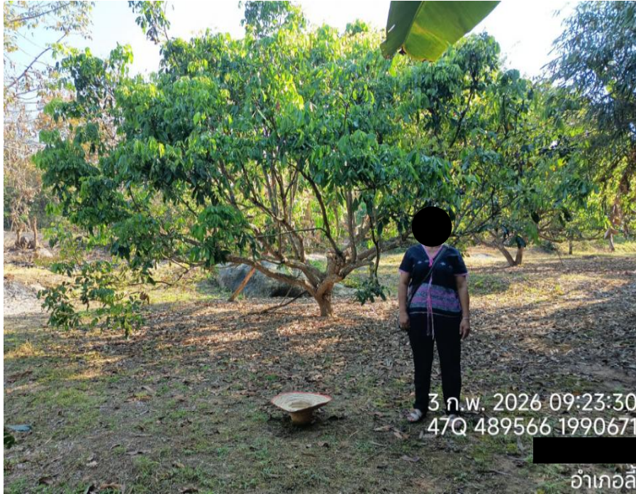
ผลการอัปเดตภาพโครงการฯ อำเภอลี้ (ตัดยอดข้อมูล ณ วันที่ ๓๐ เมษายน ๒๕๖๙)